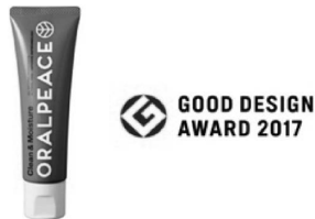
図3. オーラルピース® クリーン & モイストチュア

ン®」の良さを最大限に活かすには、合成殺菌剤や防腐剤を全く使わない自然化粧品への利用が最適ではないかと考え、その中でも商品化へのハードルの最も高い口腔ケア剤を商品化の対象として選択した。従来の口腔ケア剤(化学合成殺菌剤など)は、誤って飲み込むと体内の常在菌までも殺菌してしまい、人体への悪影響が危惧されている。一方、自然派の口腔ケア剤は天然由来で安全性は高いが、虫歯・歯周病菌に対する作用は弱くなるものが多い。そのため、天然成分のみで作られながら虫歯・歯周病菌に効く、飲み込んでも安全な口腔ケア剤の開発が強く望まれている。